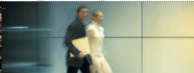
Es gilt uns zu entwickeln!