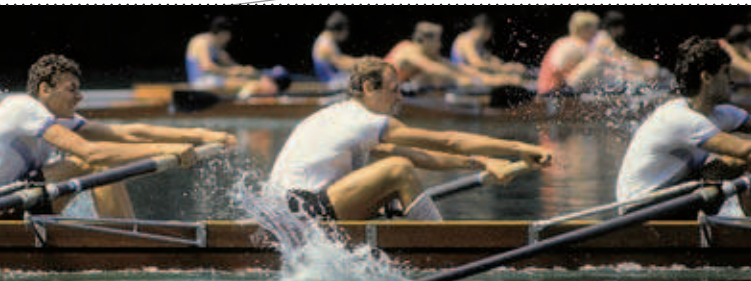
Wir bilden Teams. Wir fördern Entscheider.